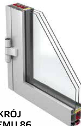
PRZEKRÓJ SYSTEMU 86 DRZWI

86 to aluminiowy system okiennie-drzwiowy o bardzo dobrych parametrach izolacyjnych oraz wytrzymałościowych, umożliwiającą wykonywanie stabilnej konstrukcji o dużych gabarytach i ciężarze. Doskonała termoizolacja osiągnięta jest dzięki dwukomponentowej uszczelce centralnej oraz możliwości wypełnienia komór profili aerożelem. Szeroki zakres szklenia pozwala na stosowanie wszystkich typów szyb dwukomorowych, akustycznych lub antywłamaniowych. Konstrukcja profili umożliwia montaż różnych rodzajów okuć obwodniowych, w tym także zawiasów ukrytych, oraz uzyskanie antywłamaniowej klasy RC3.