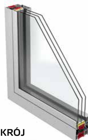
PRZEKRÓJ SYSTEMU 86 WITRYNA

86 to aluminiowy system okiennie-drzwiowy o bardzo dobrych parametrach izolacyjnych oraz wytrzymałościowych, umożliwiającą wykonywanie stabilnej konstrukcji o dużych gabarytach i ciężarze. Doskonała termoizolacja osiągnięta jest dzięki dwukomponentowej uszczelce centralnej oraz możliwości wypełnienia komór profili aerożelem. Szeroki zakres szklenia pozwala na stosowanie wszystkich typów szyb dwukomorowych, akustycznych lub antywłamaniowych. Konstrukcja profili umożliwia montaż różnych rodzajów okuć obwodniowych, w tym także zawiasów ukrytych, oraz uzyskanie antywłamaniowej klasy RC3.