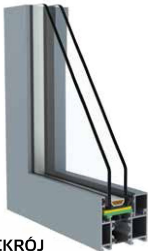
PRZEKRÓJ SYSTEMU 60 WITRYNA

Ważną zaletą systemów zewnętrznych KRISPOL jest możliwość dostosowania sposobu wykończenia profili zarówno do elewacji budynku, jak i stylistyki poszczególnych wnętrz. Opcja bikolor umożliwia zastosowanie odmiennej kolorystyki z zewnętrznej i wewnętrznej strony profili aluminiowych.