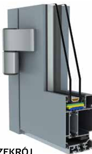
PRZEKRÓJ SYSTEMU 60 DRZWI

Produkty w systemie 60 mogą być montowane zarówno w zabudowie indywidualnej, jak i uzupełniać konstrukcje słupowo-ryglowe.